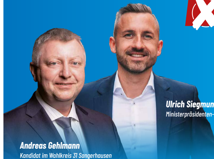
Ulrich Siegmund Ministerpräsidenten-Kandidat